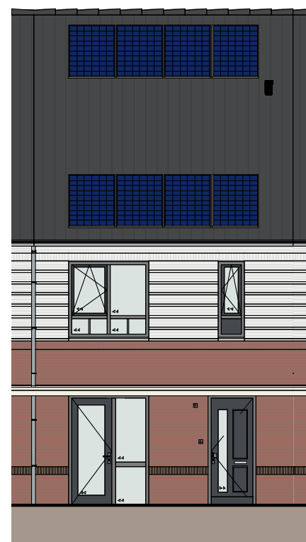
Gevelsteen genuanceerd rood en wit

bwnr. 7, 8, 9, 20, 21, 22, 23, 25, 35, 37, 38, 39, 40, 51, 52, 53, 54 en 56