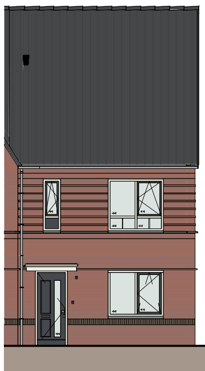
Gevelsteen genuanceerd rood