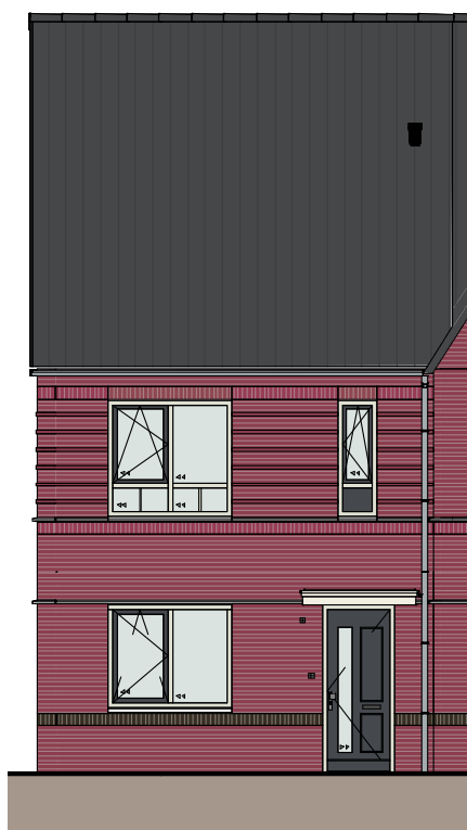
Gevelsteen genuanceerd rood-paars

Gespiegeld 1, 7, 9, 21, 23, 25, 26, 38, 40, 52, 54 en 56